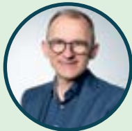
Steffen Kern, Präses des Gnadauer Verbandes

Aktuelle Infos gibt es immer wieder neu unter www.fuer2027.de . Anmeldungen sind ab Mitte September 2026 möglich.